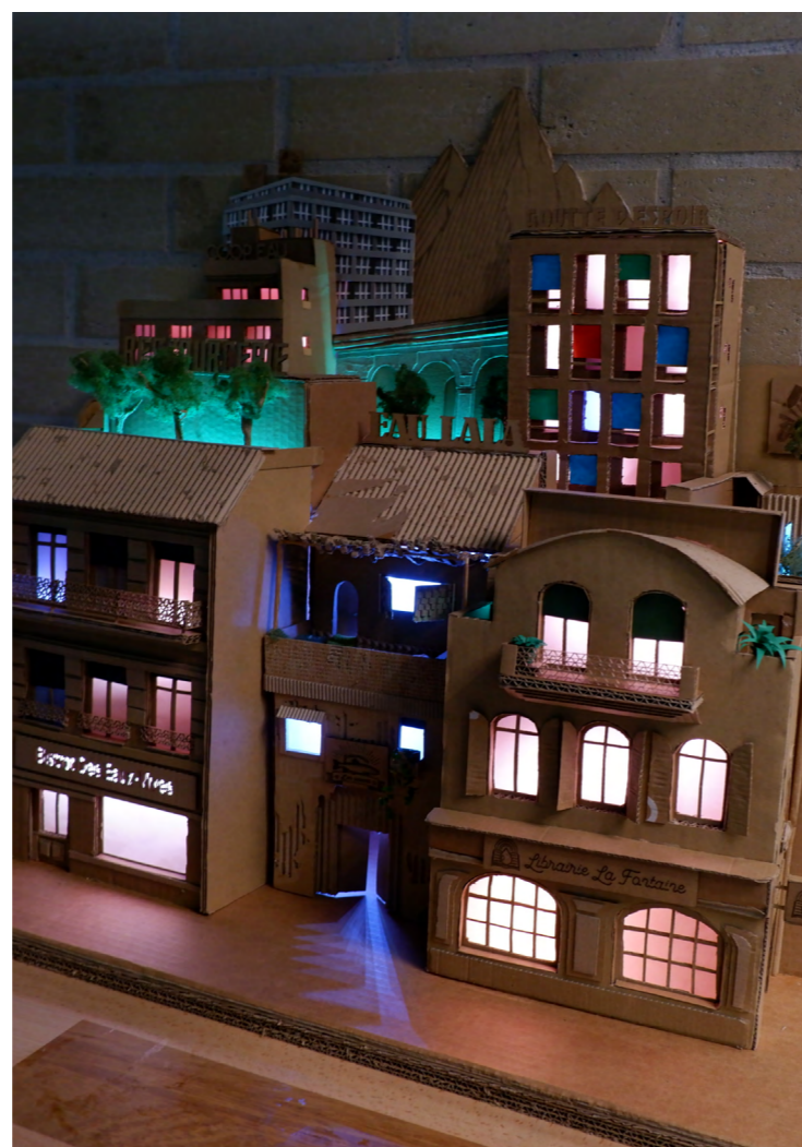
Maquette réalisée par les jeunes dans le cadre du projet Levers avec l'artiste JMK